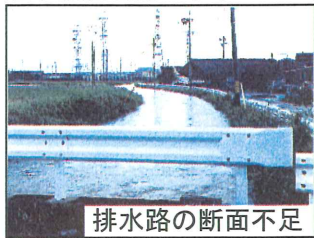
排水路の断面不足

農業水利施設の老朽化・耐震対策のための補修・更新、集中豪雨による農村地域の湛水被害を防止するための排水施設の整備等を実施。